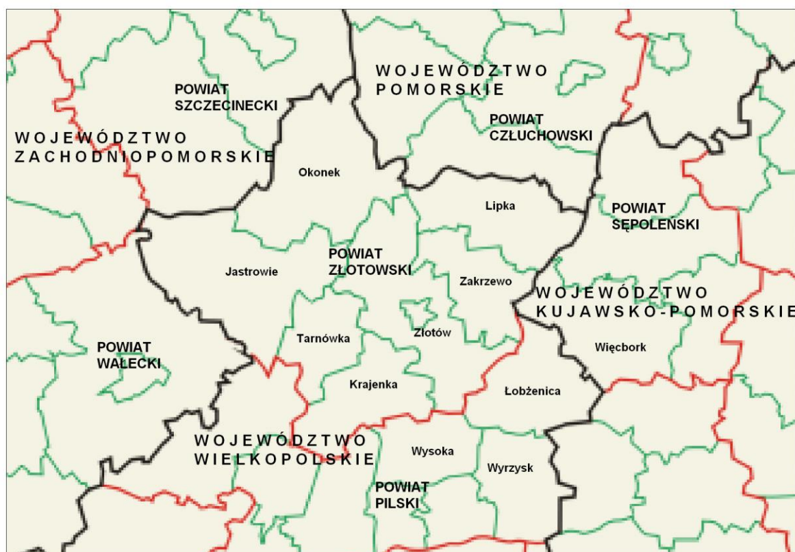
Ryc. 1. Gmina Złotów na tle Powiatu Złotowskiego.

Południowo wschodnia granica gminy jest również granicą powiatu złotowskiego i województwa wielkopolskiego, gmina Więcbork położona jest już w województwie kujawsko pomorskim. Miasto Złotów jest siedzibą gminy i powiatu a także ośrodkiem administracyjno-usługowym dla całego powiatu złotowskiego.